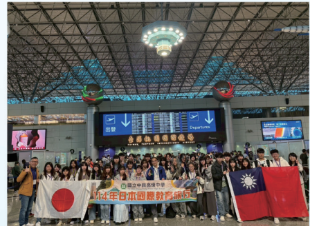
▲114年4月師生前往早稻田大學進行參訪，介紹中華民國台灣與南投縣