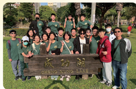
數理、語文資優班同學於成大單車節，到國立成功大學進行校系參訪(115年3月6日)