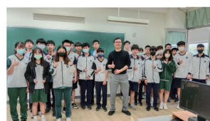
▲東海大學教授到校開設多元選修課程