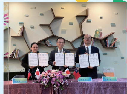
▲日本天草高校與本校簽訂MOU 兩校學生進行研究交流 (114年12月17日)