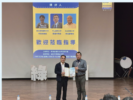
▲辦理「南投縣高級中等學校 適性學習社區， 114年自主學習聯合成果發表會」