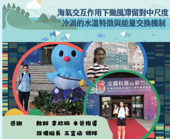
▲65屆全國科展探究精神獎