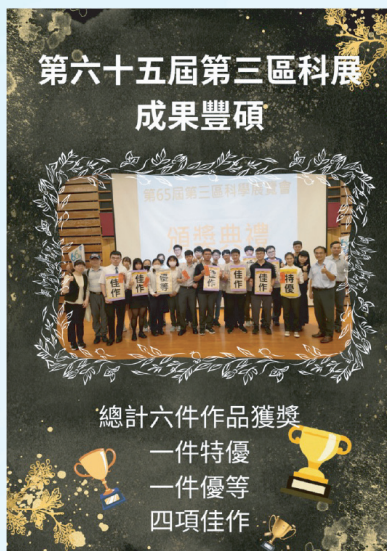
▲第65屆第三區科學展覽成果豐碩