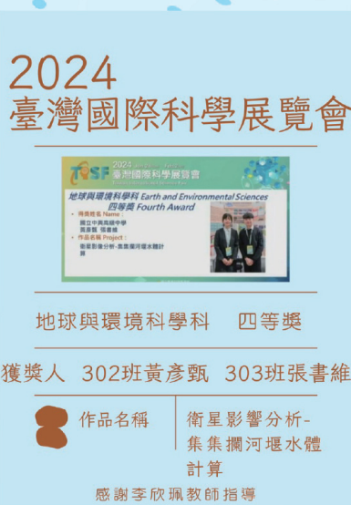
▲2024臺灣國際科學展覽