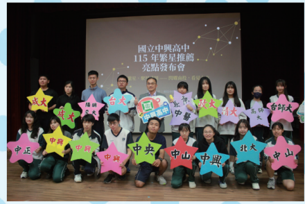
▲115年繁星推薦綠園榮耀