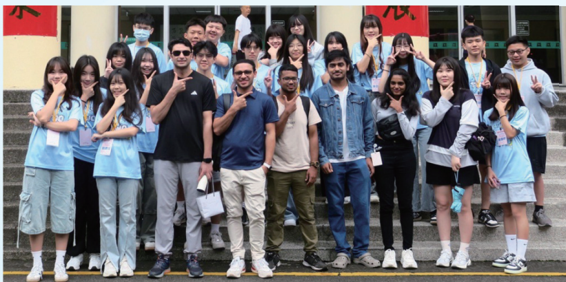
▲2024大手牽小手國際交流活動